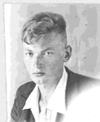
К.П. ВЛАСОВ член Оргбюро Совета